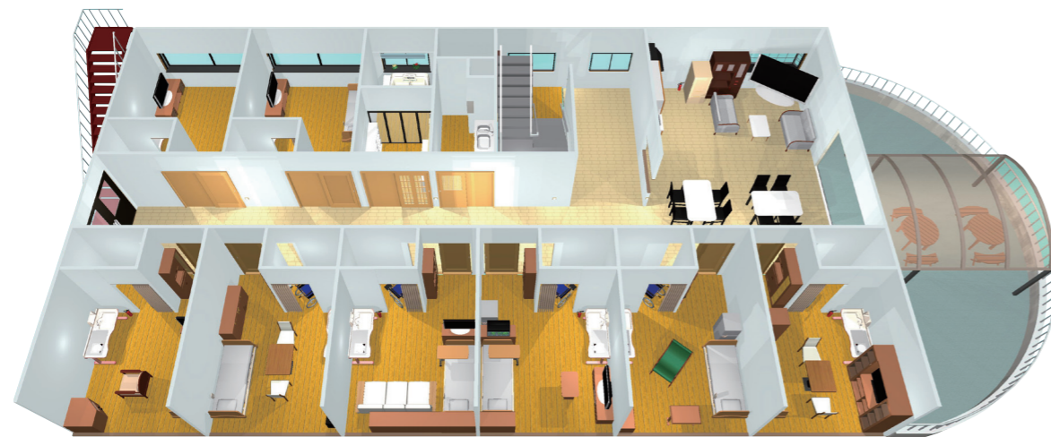
2F サービス付高齢者向け住宅(8個室)