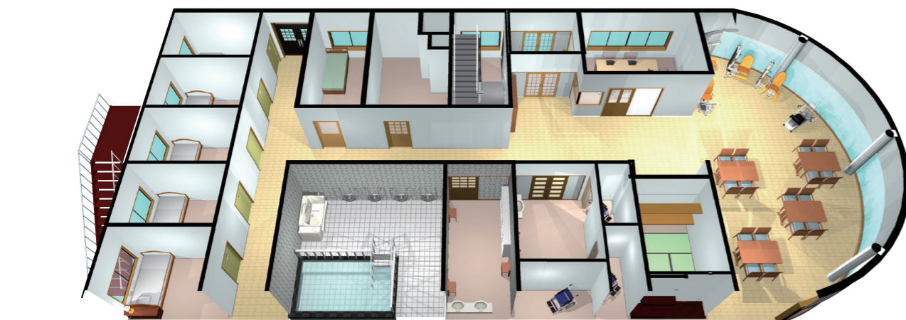
1F 小規模多機能型居宅介護施設