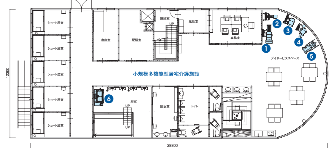
小規模多機能型居宅介護施設